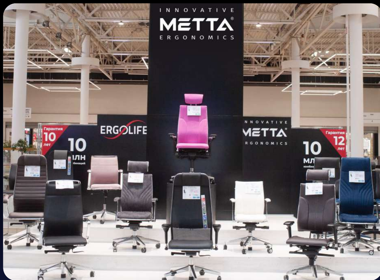
Местоположение: г. Уфа, ТРЦ Мега Площадь: 40 м 2