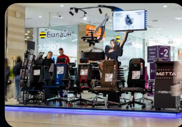
Местоположение: г. Уфа, ТРЦ Планета, площадь: 17 м 2