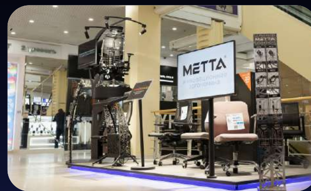
Местоположение: г. Уфа, ТРЦ Мир Площадь: 8 м 2